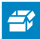
Papier i tekturę