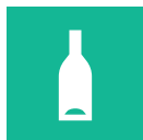
Opakowania szklane i metalowe