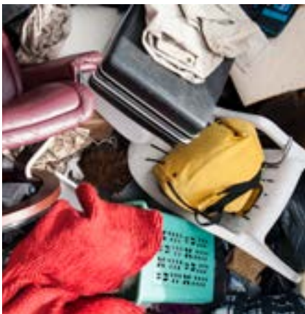
Grovavfall som møbler og madrasser