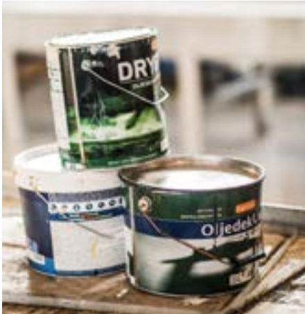
Farlig avfall og EE-avfall

Bildene viser eksempler på avfall som ikke kan kastes i eller ved beholderne.